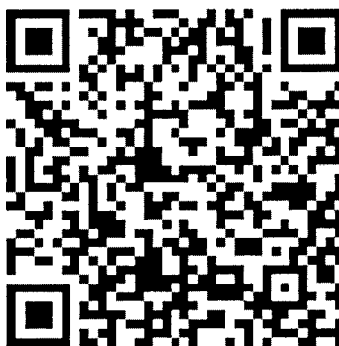
第三十二届磷复肥行业年会 付款二维码