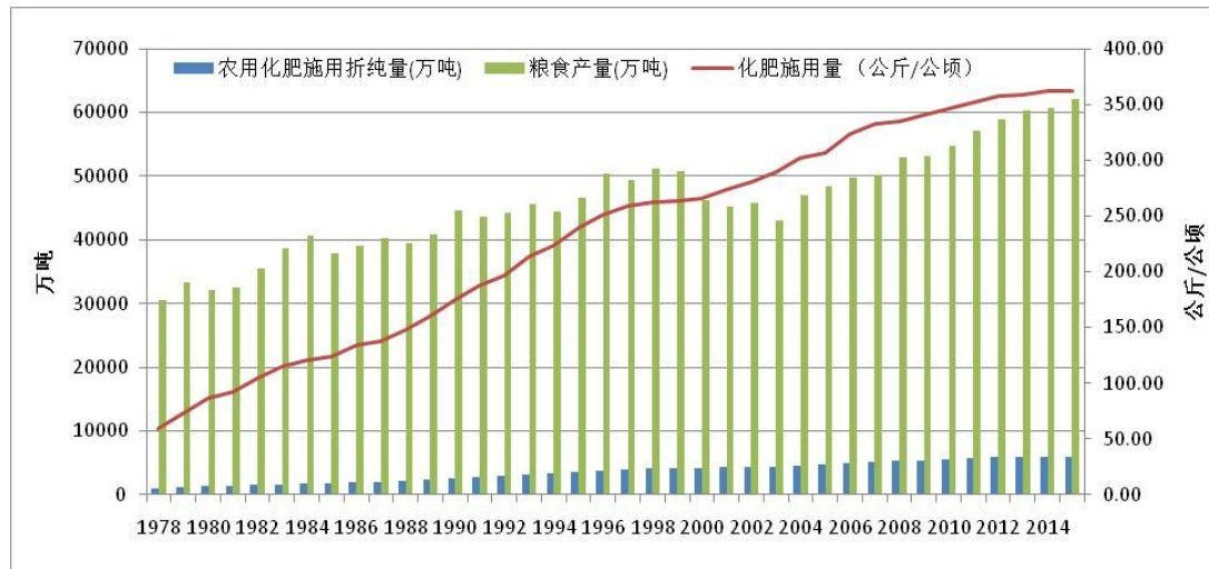
图 3-1.我国化肥施用情况

据国家统计局数据显示，我国肥料用量已经达到峰值，2015 年我国化肥施用量为 6022.6 万吨（折纯量，下同），较 1980 年的 1269.4 万吨增长了 3.7 倍。目前我国单位耕地每年化肥平均用量为 362.0 公斤/公顷，远高于美国的 120 公斤/公顷和日本 270 公斤/公顷。过量施肥、盲目施肥不仅增加农业生产成本，而且浪费资源，同时造成土壤板结和土壤酸化。